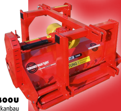
HGMU1400U Front- und Heckanbau