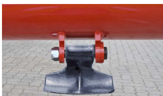
Schwerer Schlegel zur optimalen Zerkleinerung von starkem Baumgehölz